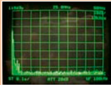
Messung an gleicher Stelle am Netz mit geeignetem Filter