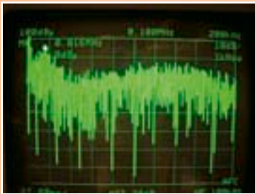
Messung am Netz ohne Filter

Mit der zunehmenden Verbreitung von elektrotechnischen Anwendungen ist auch die Nachfrage nach Feldreduzierungsmaßnahmen gestiegen. Viele Menschen wünschen sich eine Verbesserung ihrer persönlichen Umweltsituation.